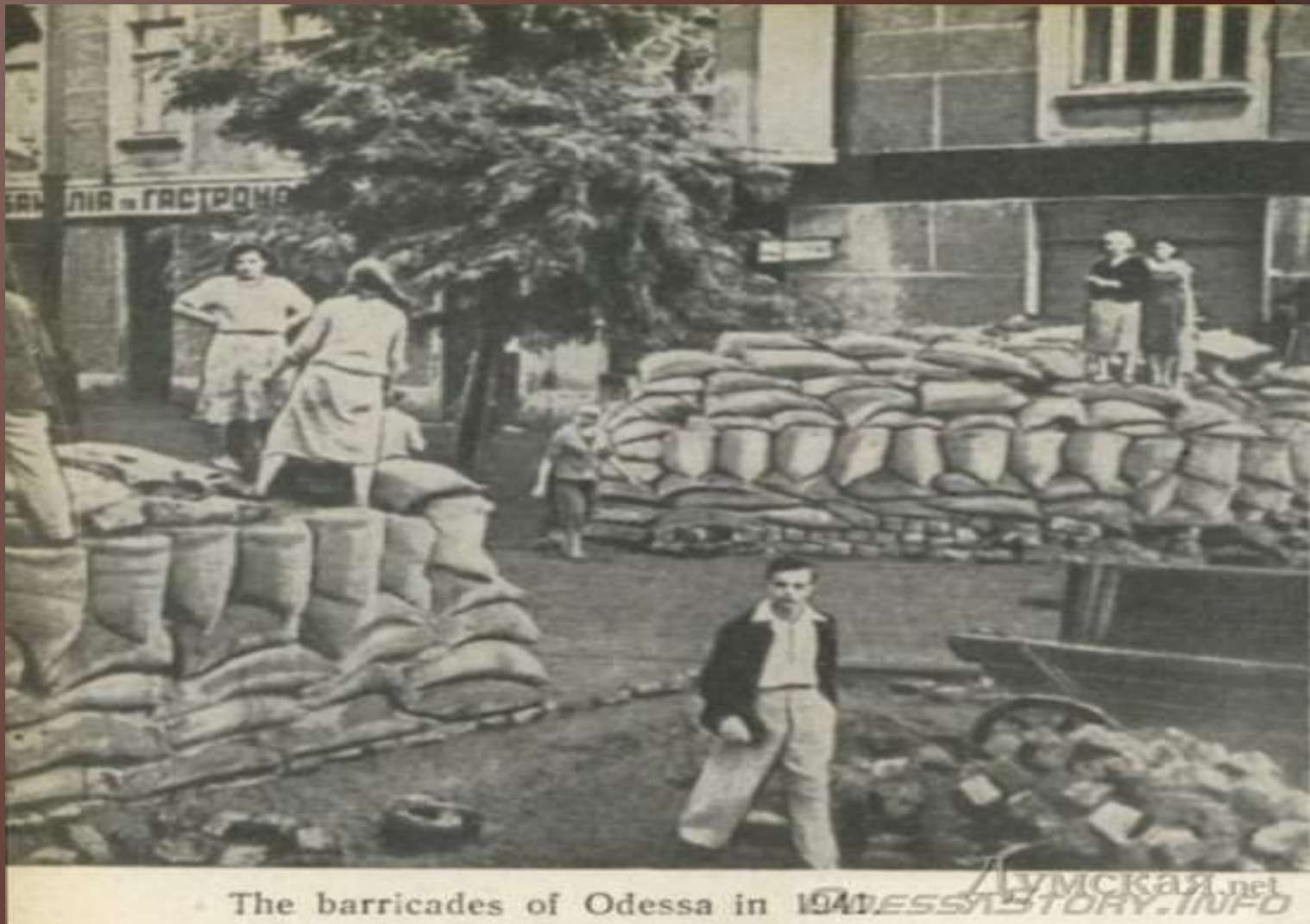
The barricades of Odessa in 1941