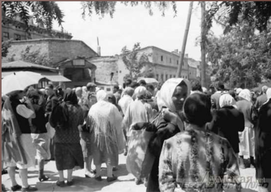
Вулична торгівля. червень 1943 р