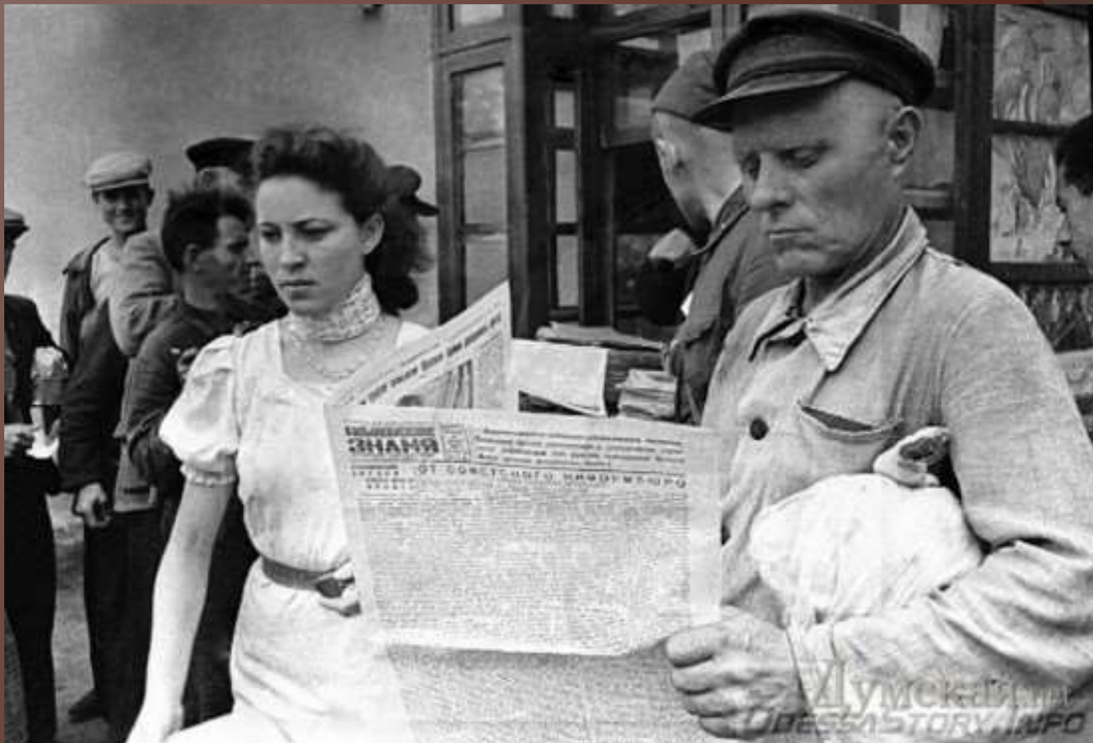
Одесити читають газету «Большеви́стское знамя» (зараз «Юг»), 1 серпня 1941 г.