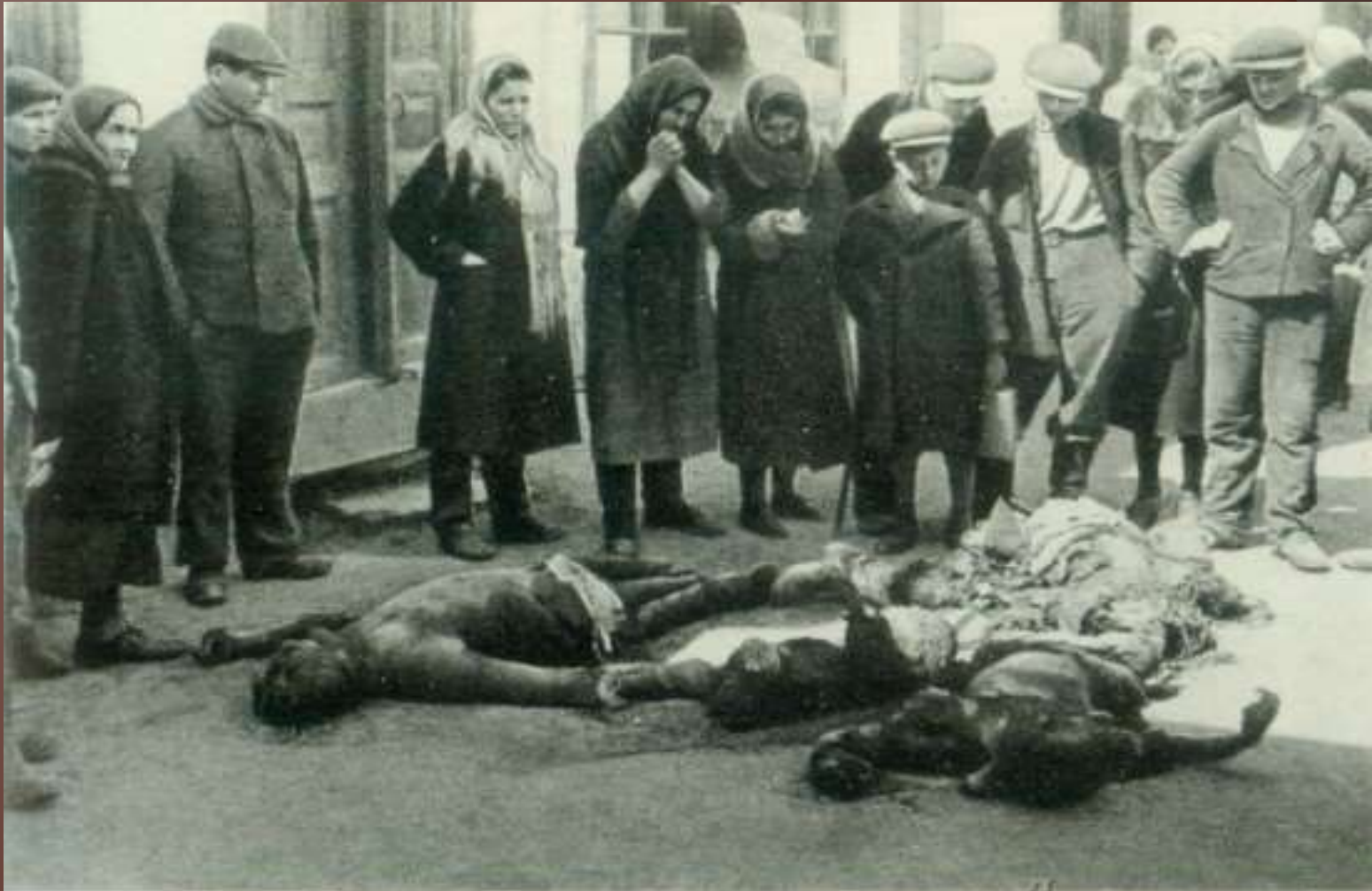
Группы советских граждан, расстрелянных оккупантами. Одесса, 1944 г.